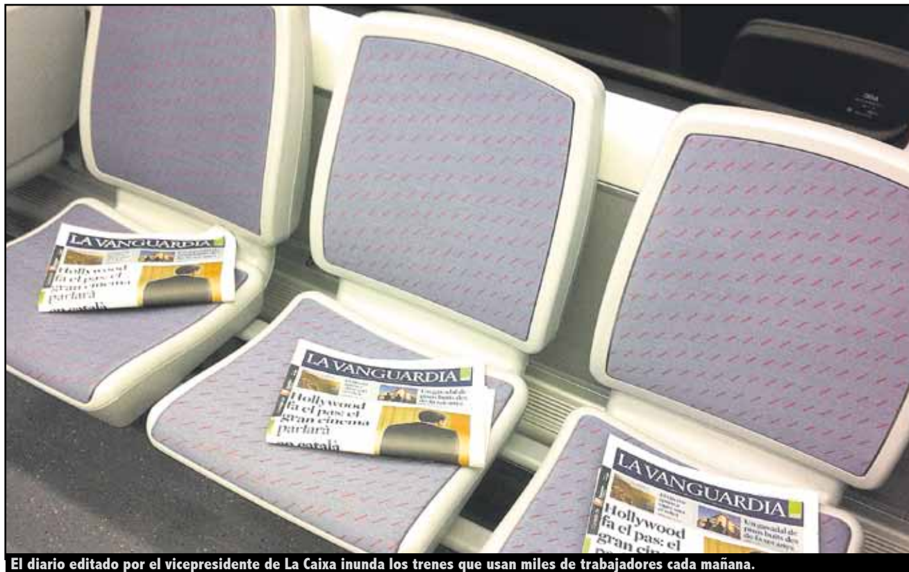
El diario editado por el vicepresidente de La Caixa inunda los trenes que usan miles de trabajadores cada mañana.